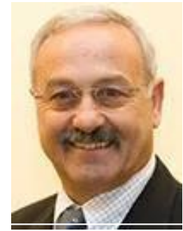
Nazih Musharbash Präsident der DPG